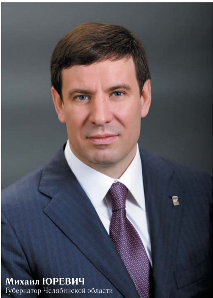
Михаил ЮРЕВИЧ Губернатор Челябинской области

4 ноября Челябинская область вместе со всей страной отметила один из самых молодых государственных праздников — День народного единства. С памятной датой жителей региона поздравил губернатор.