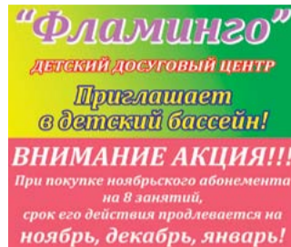
Здоровье стр. 6