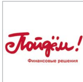
Рядом с Вами стр.5