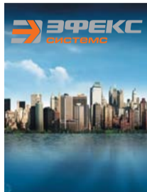
Рядом с Вами стр. 4