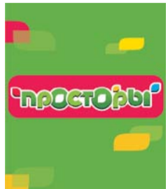
Поселок «Просторы» стр.3