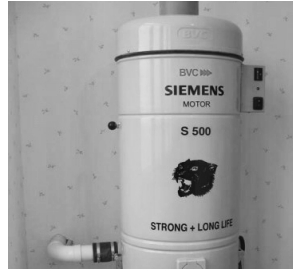
Пылесос, который живет в стене стр.3