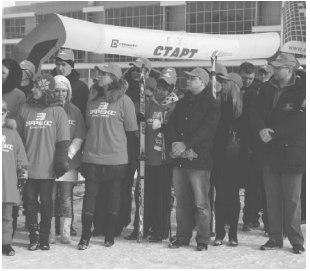
Спартакиада в разгаре стр.1

Диалог. Отвечаем на вопросы жильцов стр.2